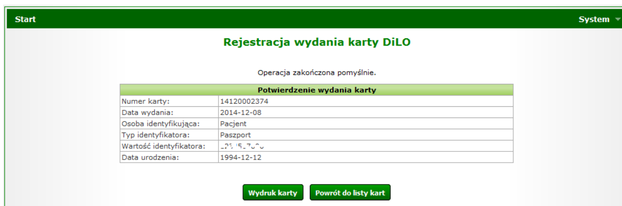
Rysunek 9 Przykładowe okno potwierdzenia wydania karty DiLO w AOS

Operacja zatwierdzania rejestracji wydania karty DiLO spowoduje wyświetlenie okna Potwierdzenia wydania karty . W oknie tym wyświetlone zostaną podstawowe dane identyfikujące kartę DiLO.