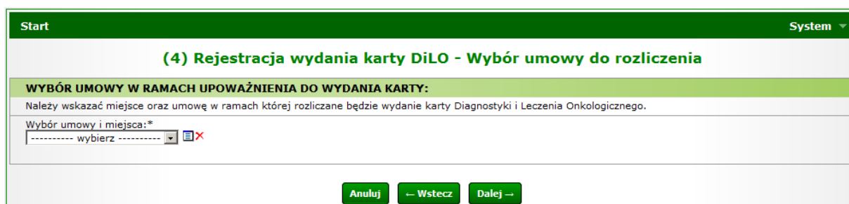
Rysunek 8 Przykładowe okno (4) Rejestracji wydania karty DiLO w szpitalu

Ostatni krok uzupełniania danych wymaga wybrania umowy i miejsca udzielania świadczeń, w ramach której nastąpi rozliczenie świadczeń związanych z wydaniem karty DiLO.