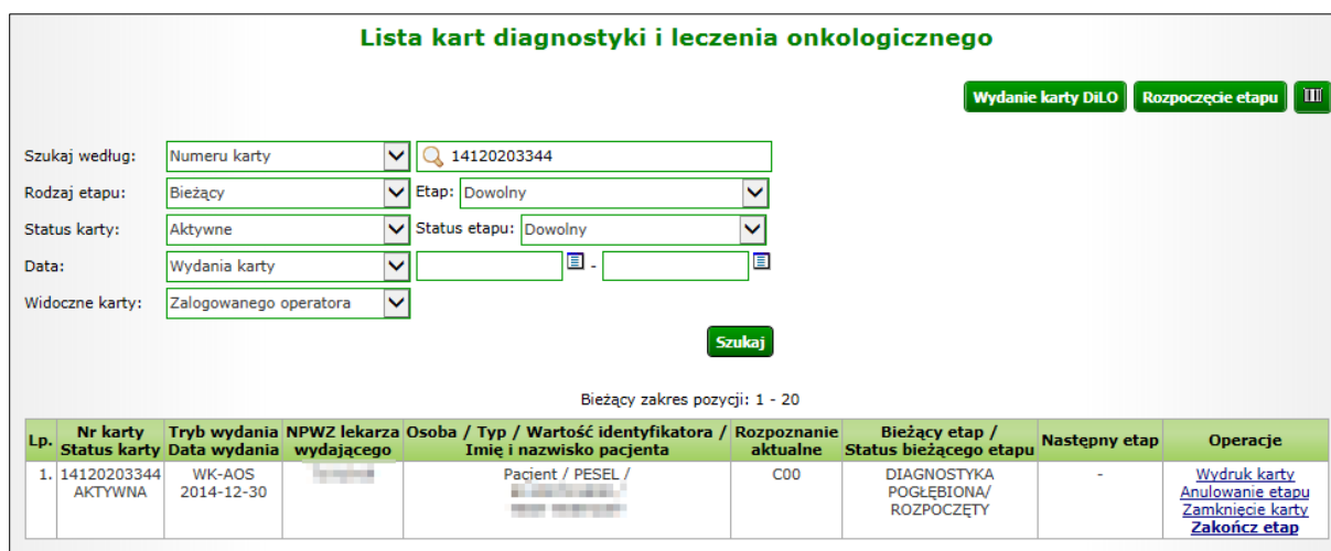
Rysunek 1-7 Przykładowa lista kart diagnostyki i leczenia onkologicznego

Po pomyślnym zarejestrowaniu etapu należy skorzystać z opcji Powrót do listy kart .